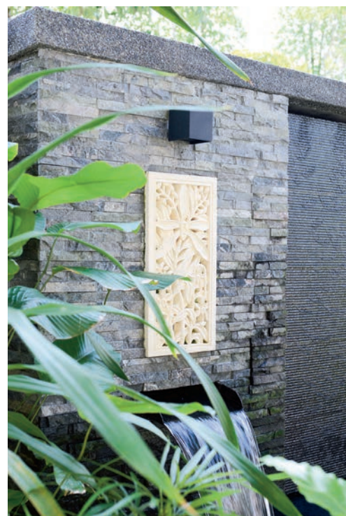
Tumbuh-tumbuhan ditanam di sudut taman berfungsi sebagai pelengkap suasana.