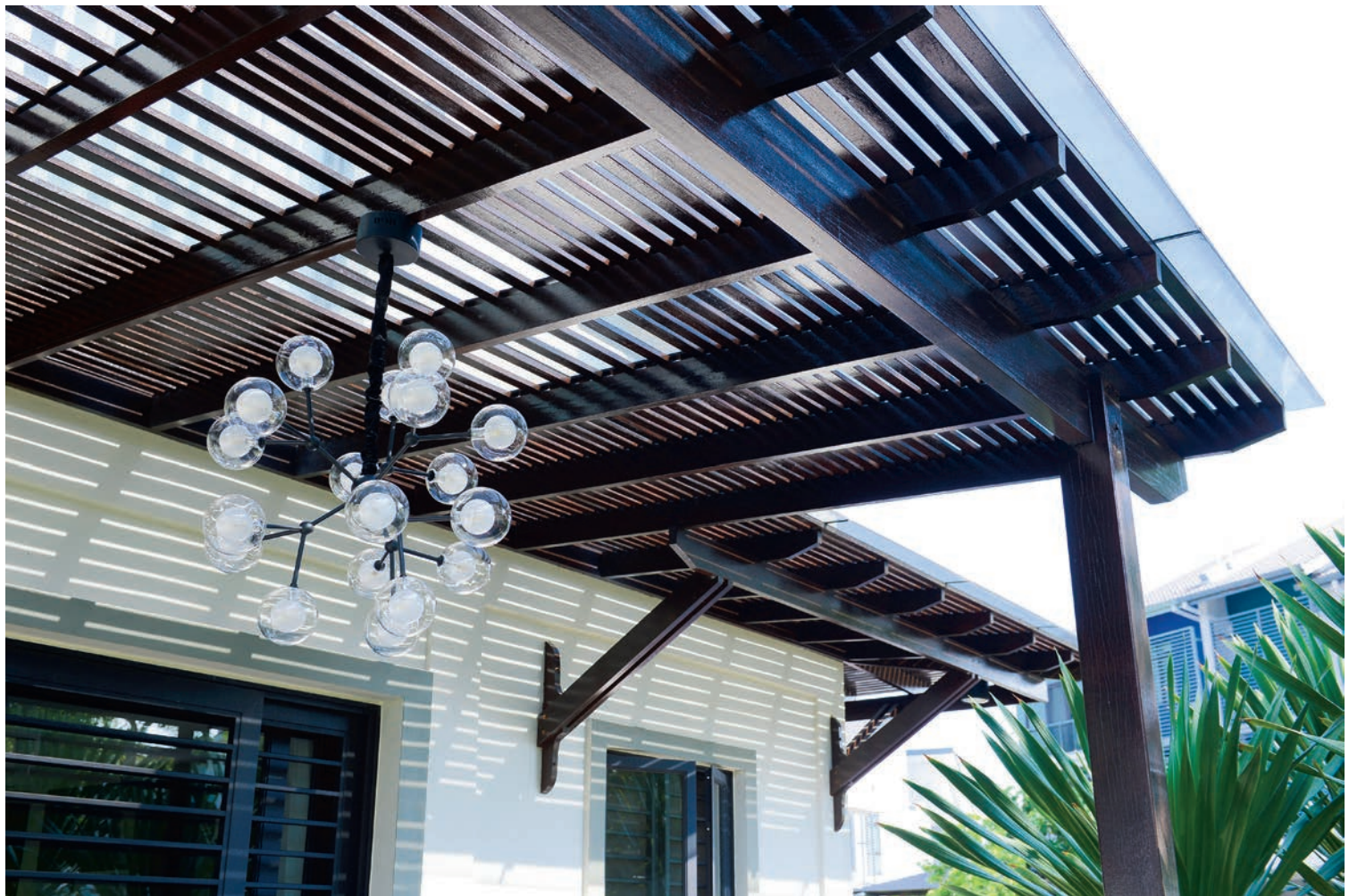
Roofing menggunakan kayu balau yang dibina sepenuhnya oleh Supercool Creative Culture kelihatan begitu kemas dan menarik hasil kerja syarikat ini.