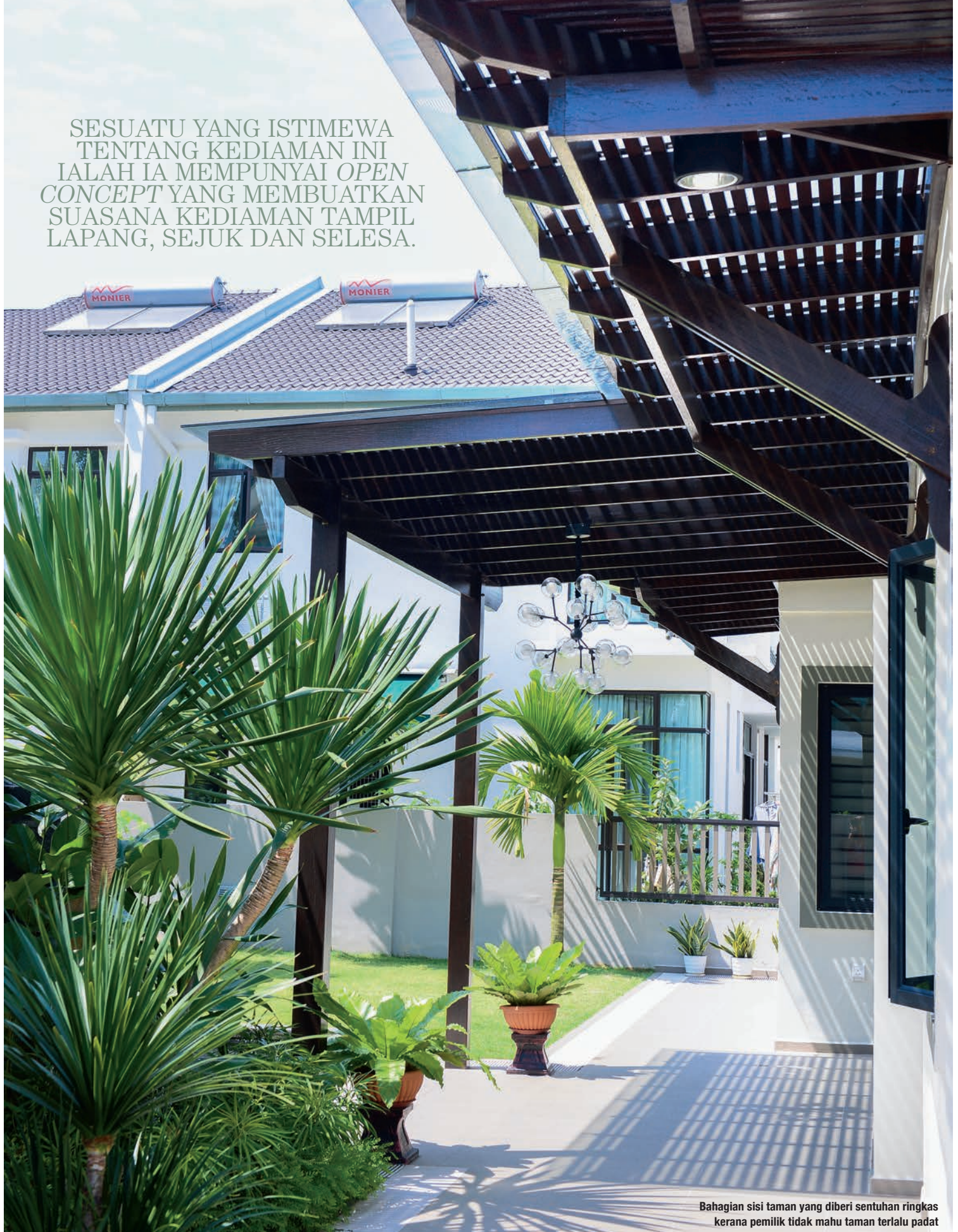
Bahagian sisi taman yang diberi sentuhan ringkas kerana pemilik tidak mahu taman terlalu padat

SESUATU YANG ISTIMEWA TENTANG KEDIAMAN INI IALAH IA MEMPUYAI OPEN CONCEPT YANG MEMBUATKAN SUASANA KEDIAMAN TAMPIL LAPANG, SEJUK DAN SELESA.